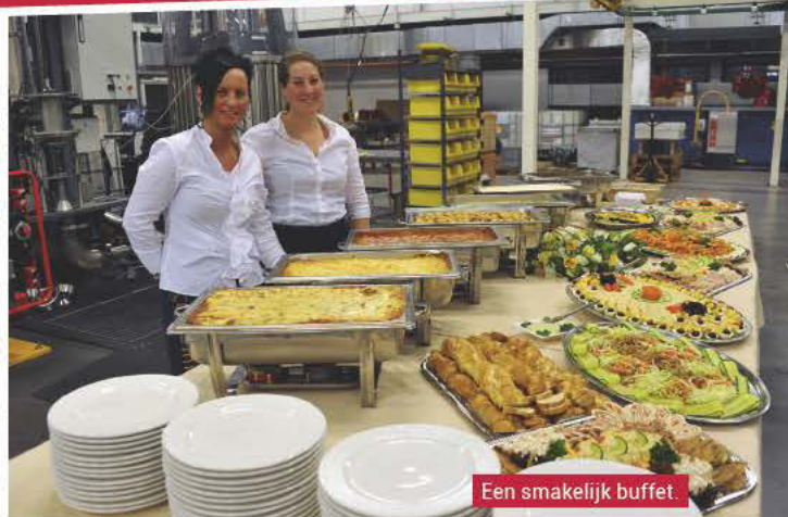
Een smakelijk buffet